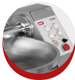
Tableau de commande 23L et 40L 2 vitesses

Pantalla de control 23L y 40L 2 velocidades