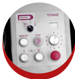
Tableau de commande 45 variateur