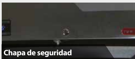
Chapa de seguridad