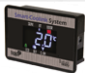
Control de temperatura inteligente remoto vía Bluetooth