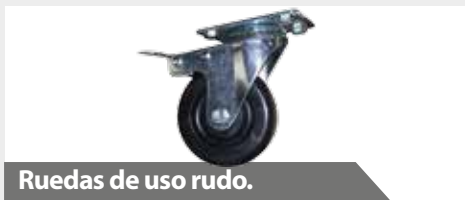
Ruedas de uso rudo.