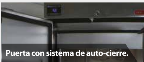
Puerta con sistema de auto-cierre.